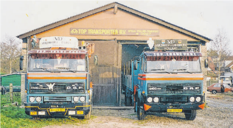
De hal aan de Vaarkamperengweg in Lunteren.