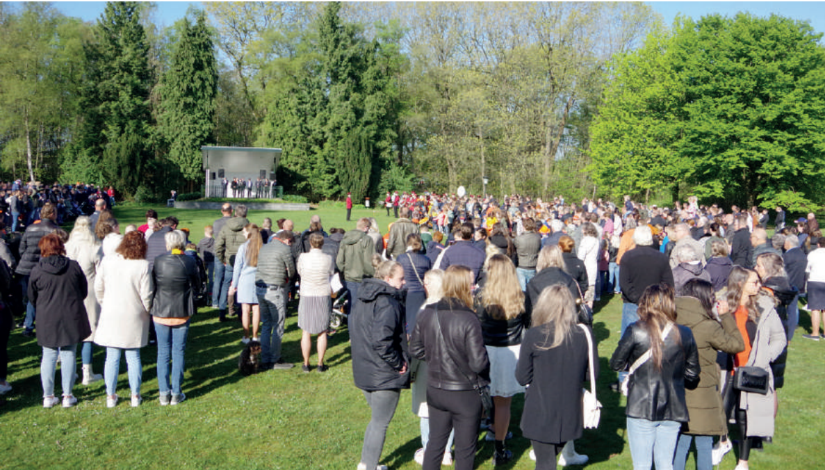
De vlaggenparade in Harskamp.