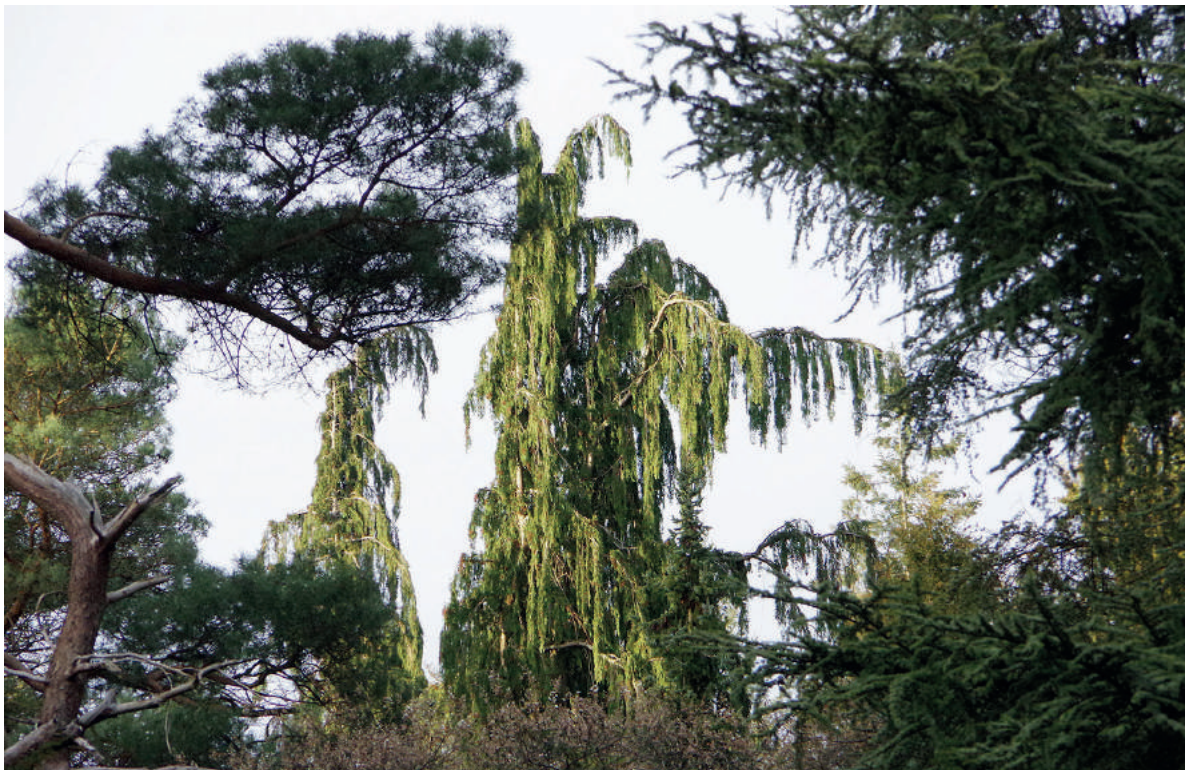
De avondzon zette de 90-jarige jubilaris in een gouden gloed.