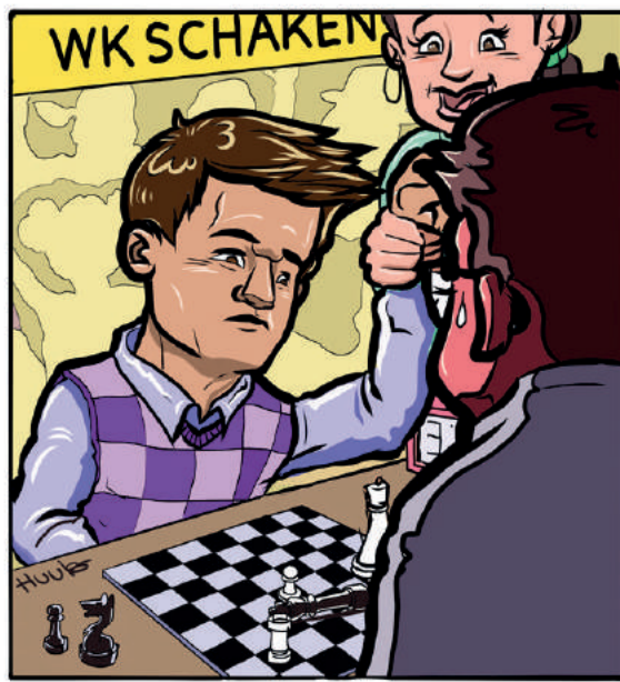
Oplossing vorige week

Wereld Autisme Dag Op 2 april is het Wereld Autisme Dag voor meer begrip voor mensen op het autismespectrum. Een spectrum want de verschillen onderling zijn groot. Gelijk is dat allen een stuk gevoeliger zijn dan de doorsnee mens. Hun hersenen staan wagenwijd open voor prikkels en met minder filter dan de doorsnee mens komt alles keihard binnen. Waar de één een schurende broeknaad als een kwelling ervaart, kan de ander een extreem hoge pijngrens hebben. De meesten hebben moeite met het lezen van gezichtsuitdrukkingen en grapjes worden vaak te letterlijk genomen. Best moeilijk om je dan in deze wereld staande te houden