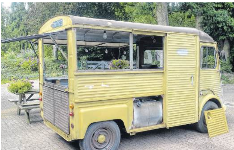
Een heel leuke kleur We reden het zo voorbij.