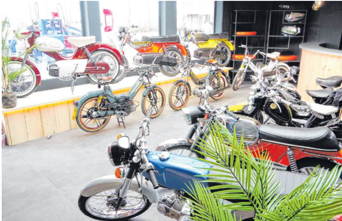
Het interieur van de nieuwe bromfietswinkel wordt ingericht voor de opendag.