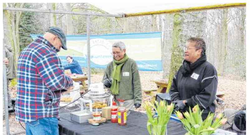
De Molukse loempia's waren een succes van de Derde Lunterse Uitmarkt.

Tot slot nog even: de Molukse loempia's waren, met een beetje sambal of pittige saus, niet aan te slepen. Chapeau voor de dames.