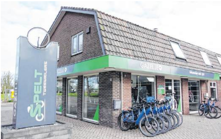
De winkel van Spelt Tweewielers aan de Barneveldseweg.

Tot die tijd blijft deze nog even in nevelen gehuld. De drie nieuwe eigenaren richten zich hoofdzakelijk op de merken Zundapp en Kreidler, maar ook op diverse andere merken en damesbromfietsen, uitsluitend van A-kwaliteit. "Bromfietsen zijn voor ons een hobby, die we inkoopbaar en vervolgens verkoopbaar maken. Er worden weinig onderdelen verkocht, maar wel helmen en bijvoorbeeld (bromfiets)