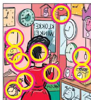
Oplossing puzzel vorige week

PAASHAAS IS MOE De week begint lekker, met vrij op maandag 6 april, tweede Paasdag, want Pasen is nog lang niet voorbij. Sterker nog: tot en met 9 april is het Pesach, het Joodse paasfeest, de viering van de bevrijding uit de slavernij in Egypte, terwijl Orthodox Pasen pas 12 april start. Dan vieren de Griekse- en Russisch-orthodoxe kerk precies hetzelfde Pasen. Dit komt door het gebruik van verschillende kalenders: de Gregoriaanse voor Pasen, de Joodse voor Pesach en de Juliaanse kalender voor Orthodox Pasen. Toch is alles met elkaar verbonden. Pasen komt namelijk van het Latijnse Pascha en dat komt weer van het Hebreeuwse Pesach. En de Pesach-maaltijd was weer het Laatste Avondmaal van Jezus. Welke kalender je ook volgt, het is de perfecte tijd om nog even lekker in de feeststemming te blijven.