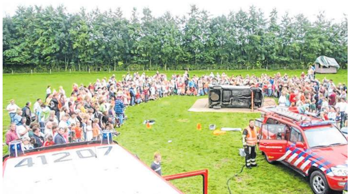
Foto van het 60-jarige bestaan.