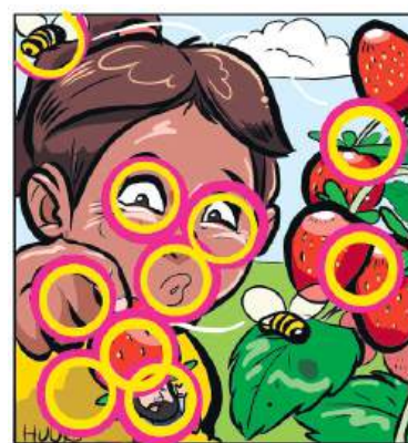
Oplossing puzzel vorige week