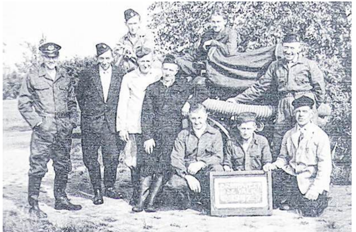
Het eerste team van Brandweer De Valk.

Meer informatie vind je op www.brandweerdevalk.nl