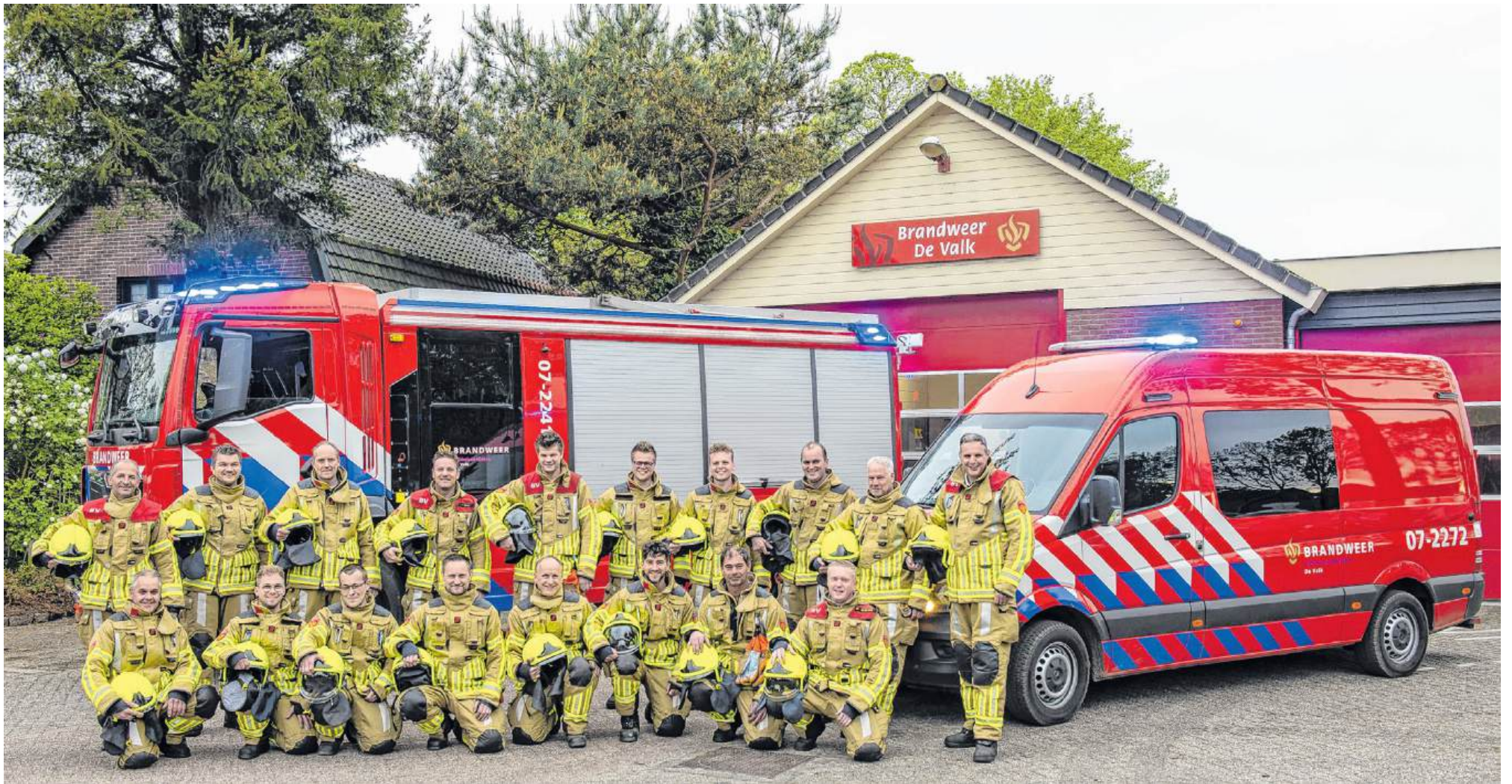
Het huidige team van Brandweer De Valk.